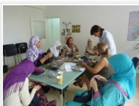
Una de les activitats de Can Gelabert amb mares de família.

La Fundació Can Gelabert és una petita entitat social sense ànim de lucre, amb seu social a Barcelona, que duu a terme diverses accions i projectes d'intervenció social que persegueixen grans resultats a llarg termini. Des de la seva creació el 2003, es dedica a la prevenció de l'exclusió social de les persones o grups més desfavorits intentant facilitar-ne el desenvolupament i la integració i –cosa molt important- la participació. També realitzen formació a emigrants hispanoparlants de la tercera edat com a multiplicadors i animadors socioculturals a Alemanya perquè, alhora, puguin ajudar altres emigrants també d'edat avançada.